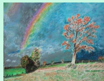
4 ème prix