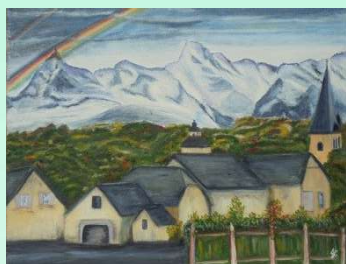
1 er prix

En attendant les résultats, voici les primées de 2015 :