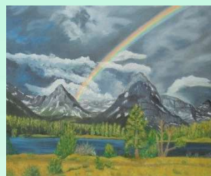
2 ème prix