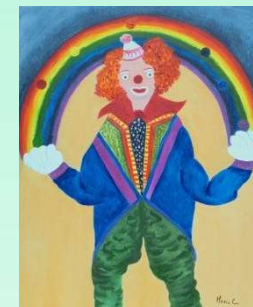
Prix de l'originalité