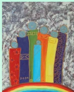
3 ème prix